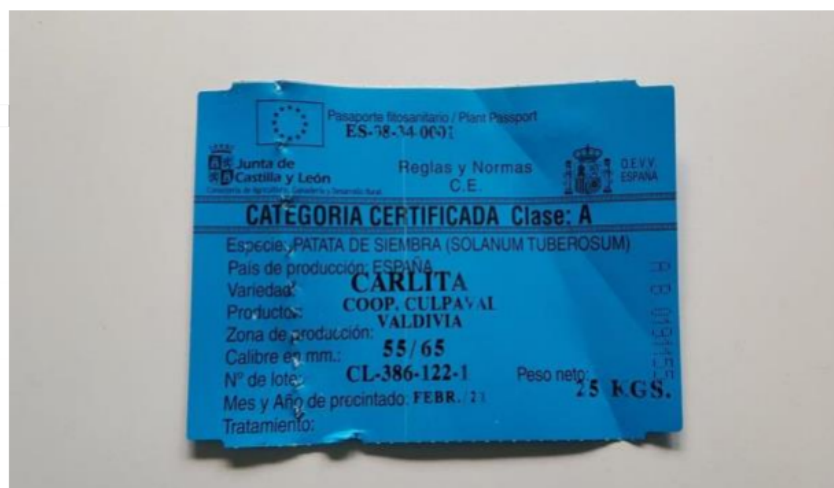
Pasaporte Fitosanitario de patata de siembra.

El Pasaporte Fitosanitario (PF) es la marca oficial (ETIQUETA) que acompaña al material vegetal de reproducción en su movimiento por el territorio de la UE cuyo objeto es acreditar que dicho envío va libre de plagas cuarentenarias y que cumple con los niveles de tolerancia exigidos para las RNQPs (plagas reguladas no cuarentenarias) .