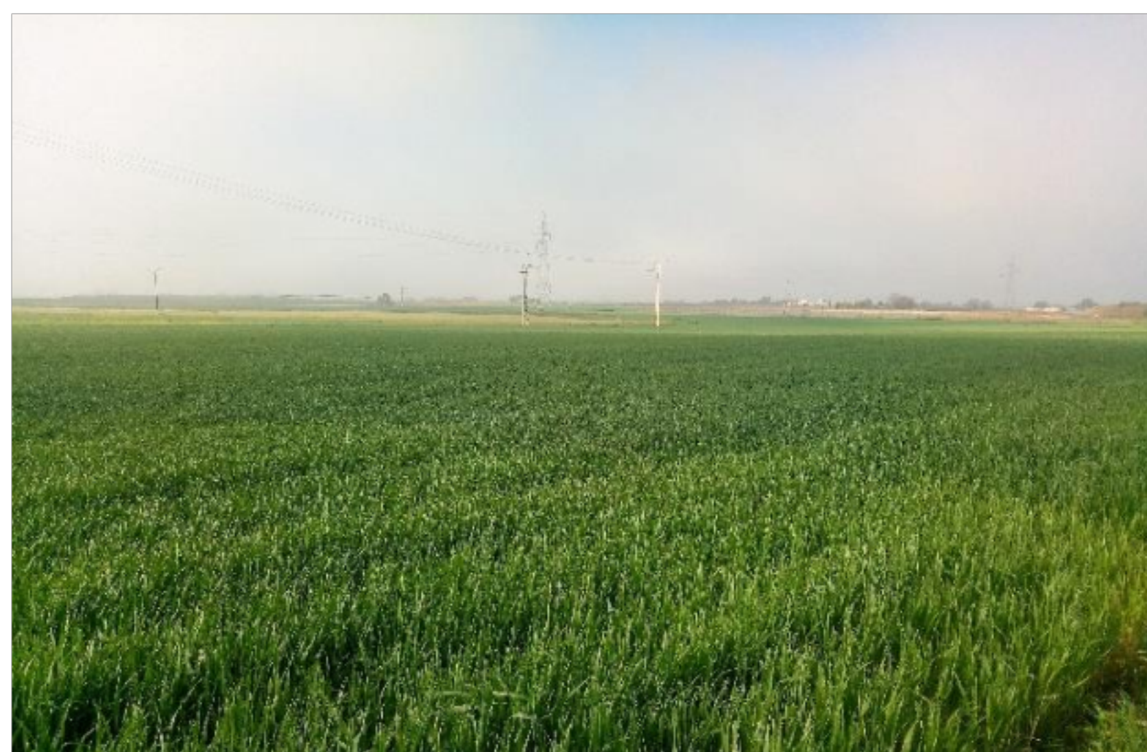
Campo de trigo duro sembrado con semilla certificada.