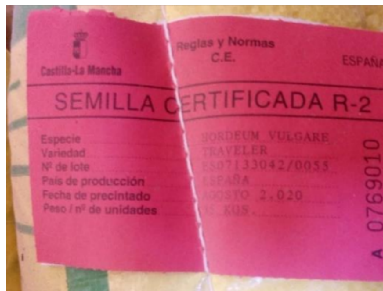
Semilla certificada de segunda generación.