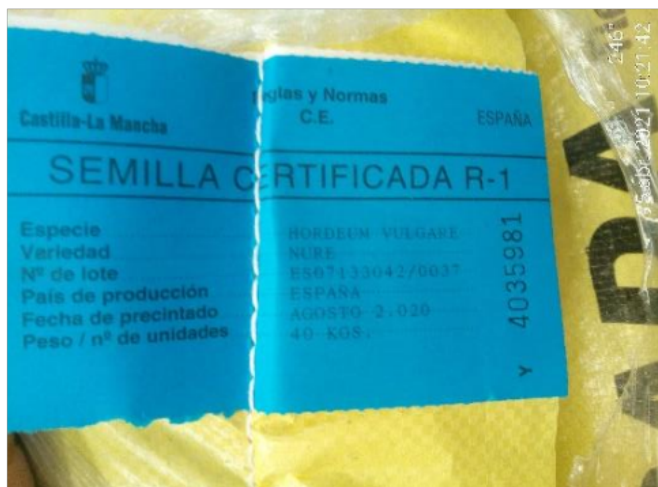
Semilla certificada de primera generación.