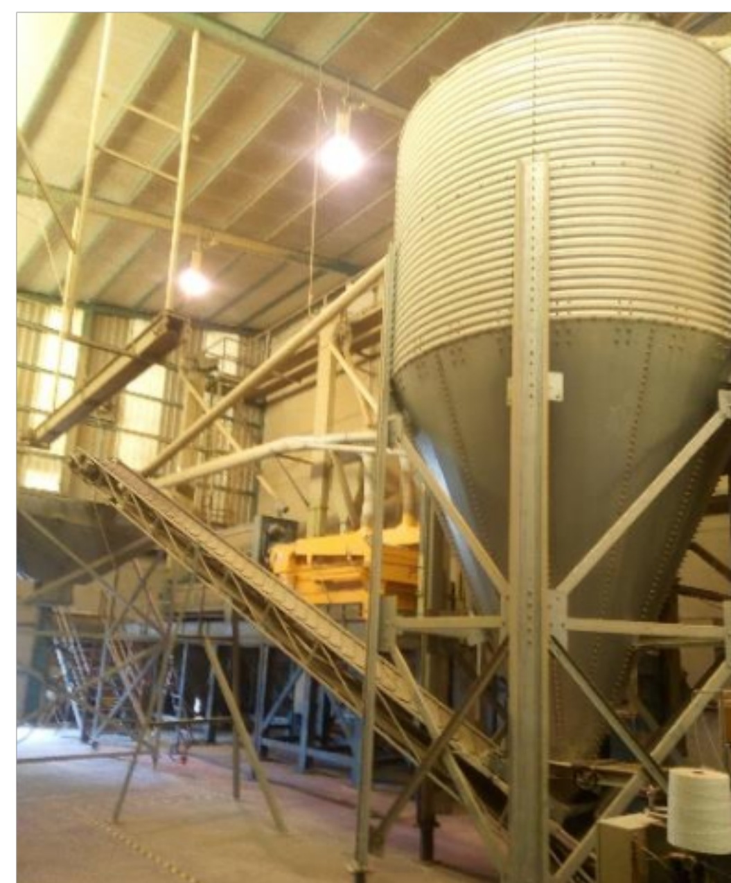
Tolva de alimentación.