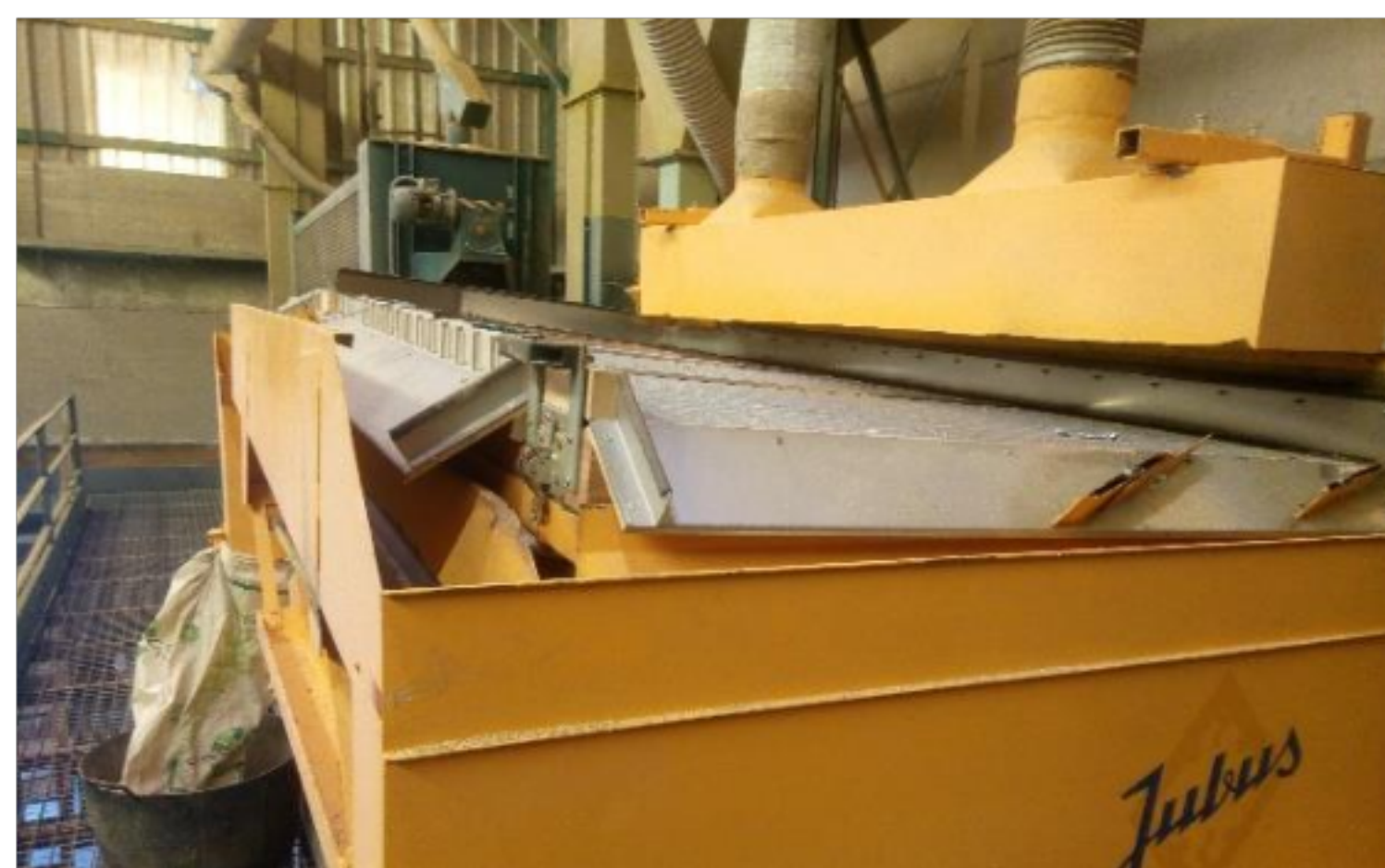
Separadora de calibres.