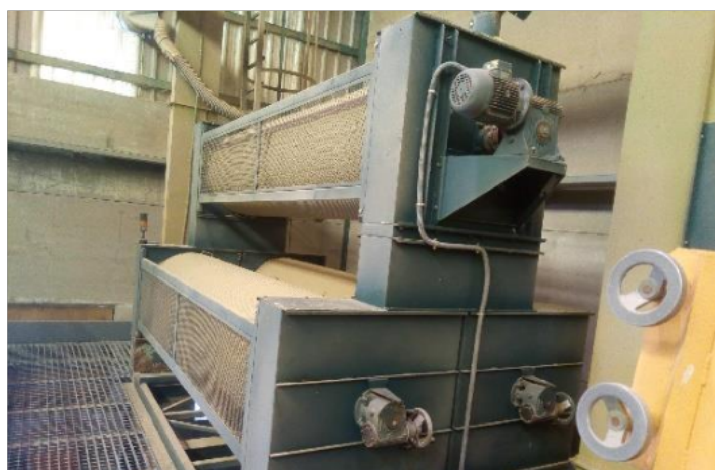
Tambores rotatorios de limpieza de grano.